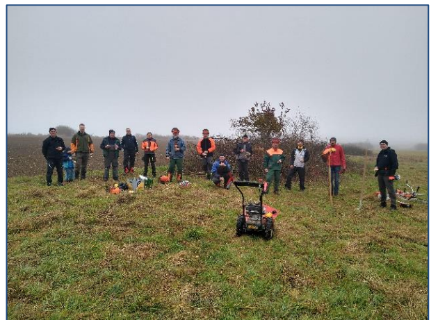
Beweidung und Heckenpflege in den Mühlwiesen.