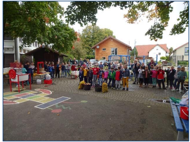
Apfelsaftaktionen mit Grundschule und Kindergarten Vollmaringen.