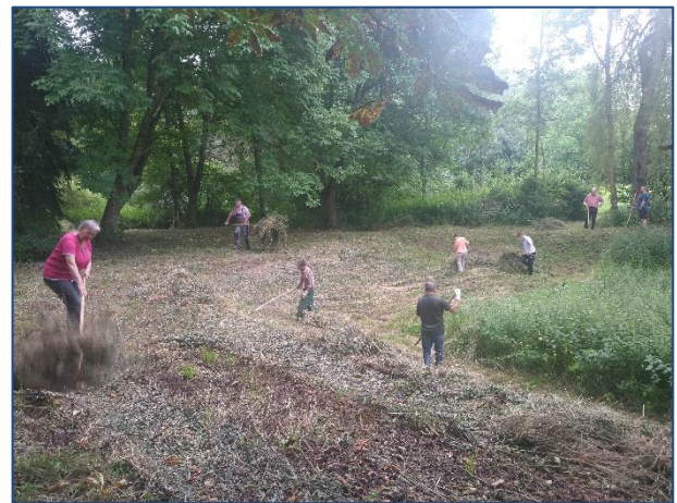
Jährliche Pflegemaßnahme (Lehnd und Saib).