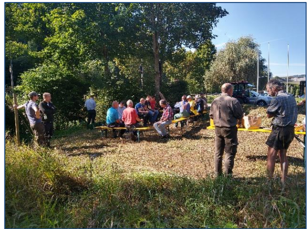
Jährliche Pflege des Kreuzertales in Abstimmung mit der Stadt Nagold mit Unterstützung anderer Gruppen. Organisation durch NABU-Vollmaringen.