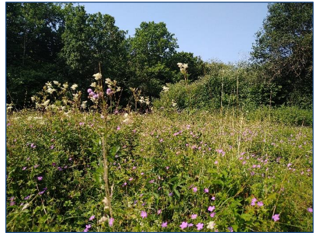
Bilder aus unserem Feuchtbiotop Lehnd.